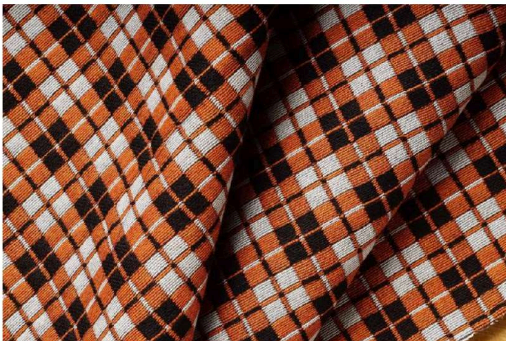
Schmid - Trend Autunno/Inverno 19/20

Schmid è una società leader del settore della calzatura e degli articoli di pelletteria. È stata fondata nel 1942 a Milano dallo svizzero Walter Schmid e oggi è posseduta da tre imprenditori italiani: tra questi Paolo Ciccarelli, attuale presidente e ceo dell'azienda. La Schmid non è solo un fornitore di tessuti e materiali, ma un partner strategico in grado di assicurare ai propri clienti qualità, innovazione e servizio su misura. È partner dei più importanti designer del mondo della moda, non solo in Italia ma anche negli Stati Uniti e nei maggiori mercati europei.