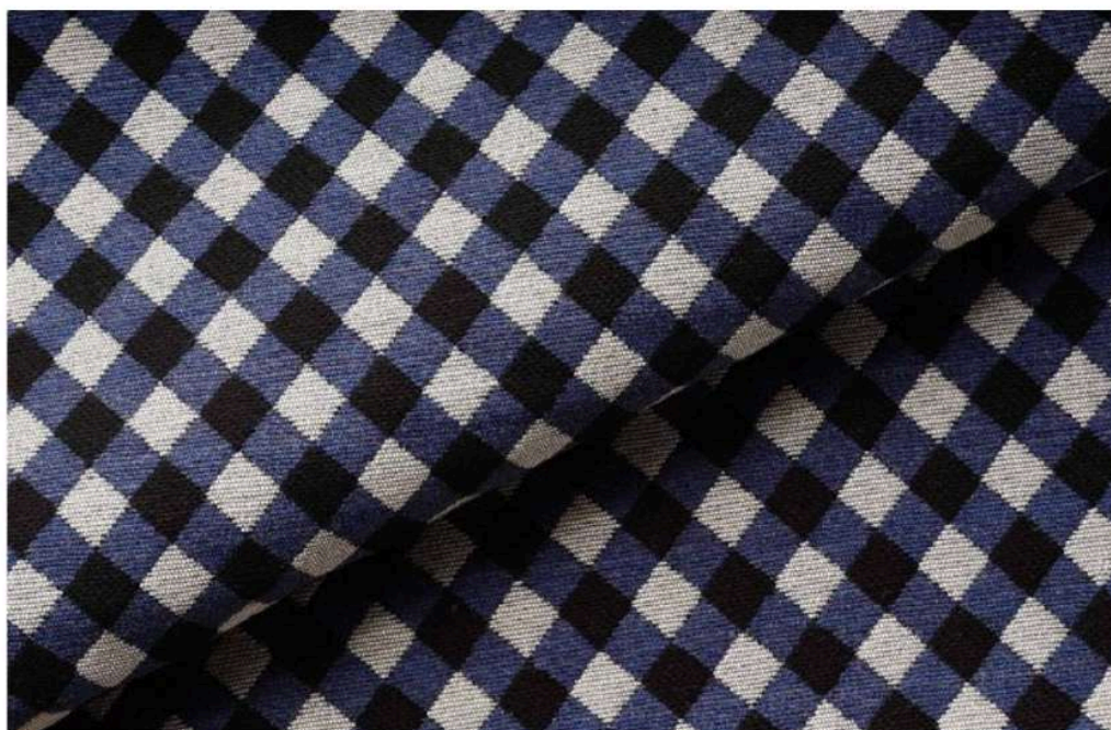
Schmid - Trend Autunno/Inverno 19/20

La stagione autunno-inverno 2019/20 è ancora lontana. Ma, guardando alle prossime tendenze, un fatto è certo: il completo giacca e pantalone (o giacca e gonna) percorre quasi tutte le passerelle. Questo mood sartoriale e rigoroso, di norma appartenente all'universo della moda maschile, si declina anche per la donna. Pantaloni abbottonati sulla caviglia, giacche dalla scollatura profonda e a volte provocante, volumetrie contenute che si contrappongono a pellicce faux fur e a capispalla matelassé. Nella loro forma più minimale, le gonne accarezzano le curve femminili: vita alta, ruota ampia e comode tasche in sbieco dominano le sfilate.